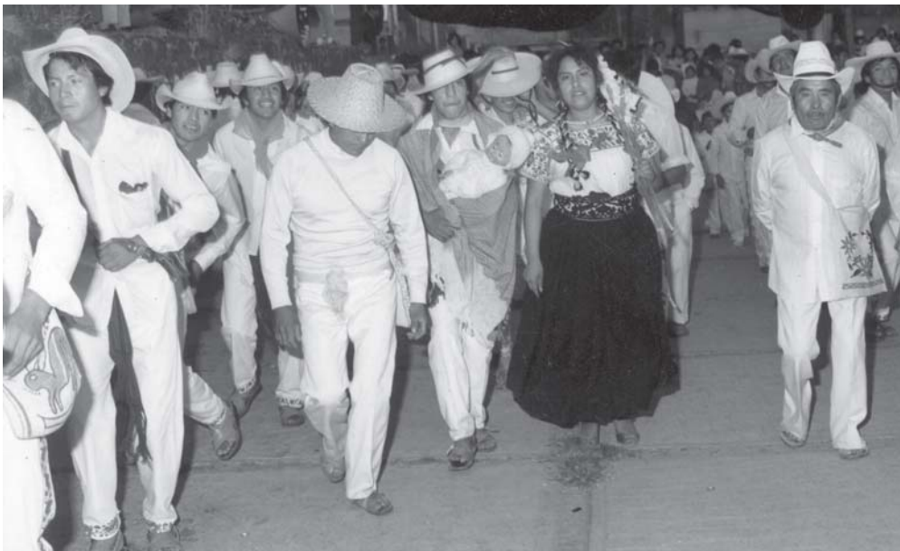
Danza de Arrieros, Xalatlaco.

para que otras personas se comprometan a participar en algunas de las múltiples actividades que contribuyen a dar esplendor a la fiesta.