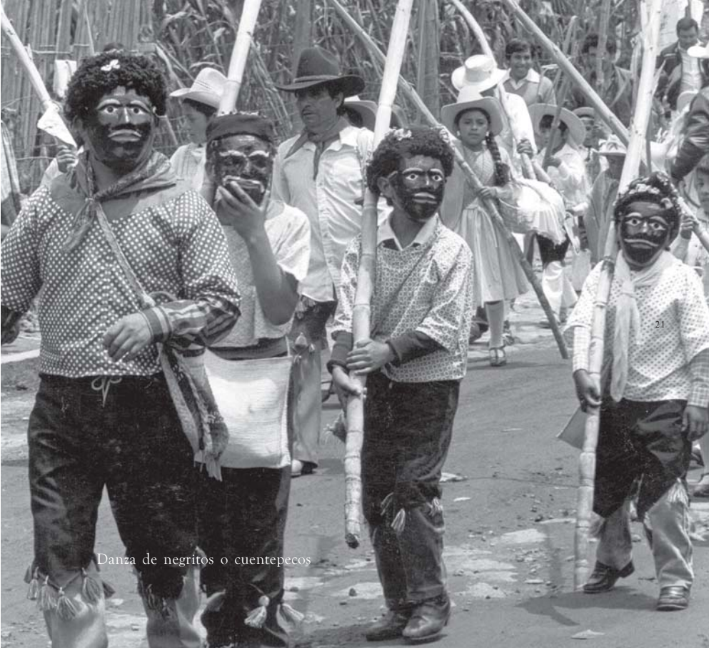
Danza de negritos o cuentepecos